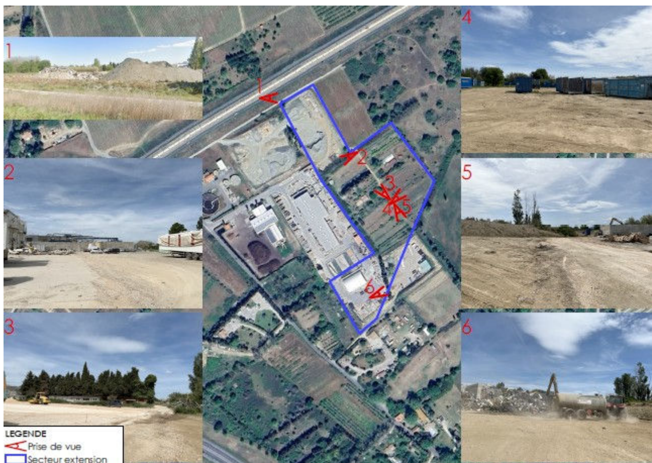
Figure 4: Vue aérienne du secteur de projet (en bleu) : rapport de présentation (RP) page 9