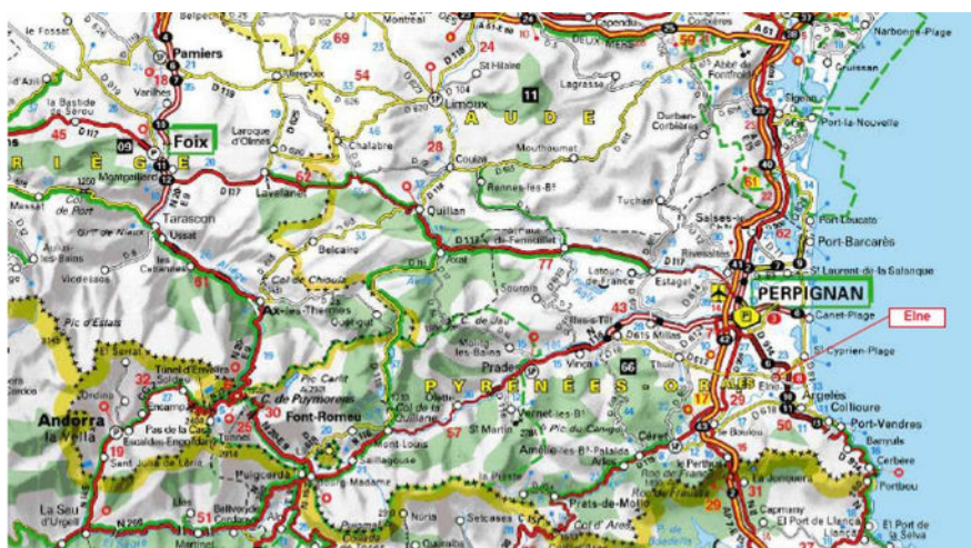
Figure 1: Situation de la commune de Elne

Elle est membre de la communauté de communes « Albères - Côte Vermeille - Illibéris » (15 communes et 55 751 habitants – INSEE 2019) et est incluse dans le périmètre du schéma de cohérence territoriale (SCoT) « Littoral Sud » dont la révision a été approuvée le 2 mars 2020 et dont elle constitue un « pôle structurant » 2 .